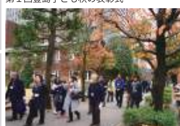
西池袋悠悠々散歩・立教池袋キャンパス100周年記念講演会