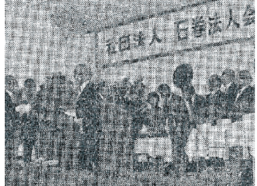
石巻法人会と姉妹法人会の盟約締結