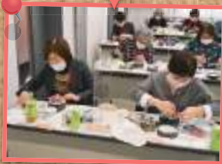
ドライフラワー教室