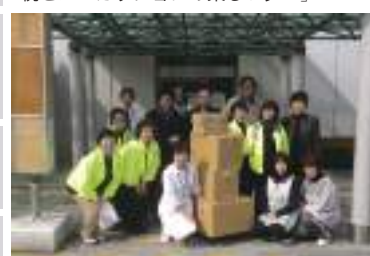
女性部会被災地支援プロジェクト「本を被災地の図書館へ贈ろう」