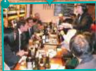
一般教養講演会(ワイン会)