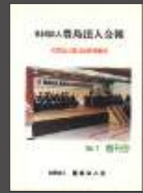
広報誌創刊号（第1号）発行