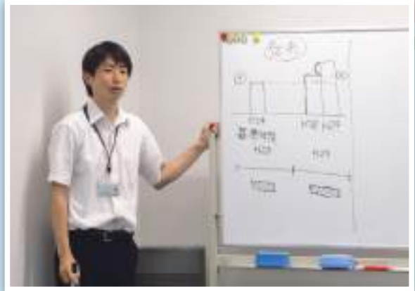
改正された税制のポイントを分かりやすく説明