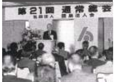
7ブロック制に移行