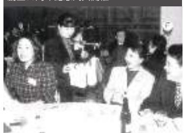
第1回健康イベント開催