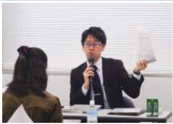
決算書作成後における各別表の記載についてを解説