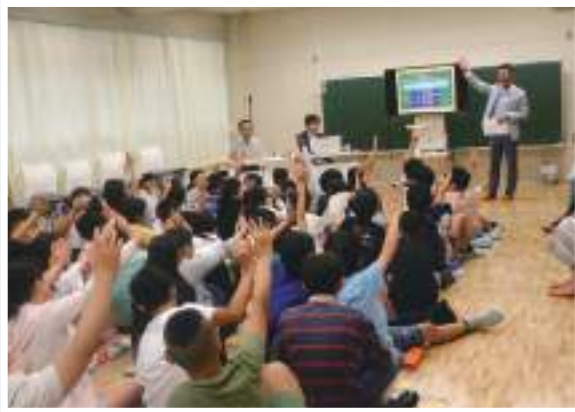
出題に元気に手を挙げる児童たち