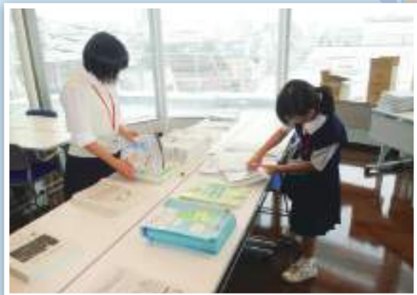
講習会資料を手際よく封入する中学生