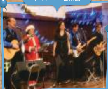
クリスマス音楽会