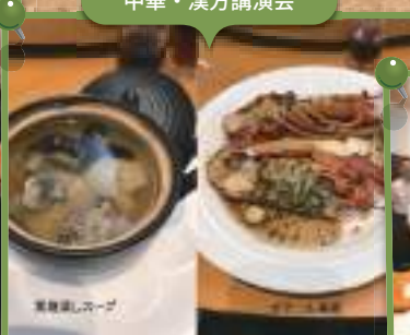
中華・漢方講演会