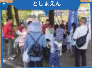
東法連青連協第4ブロック スタンプラリーin としまえん