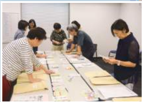
応募作品の中から一次選考する美術の先生と女性部会役員