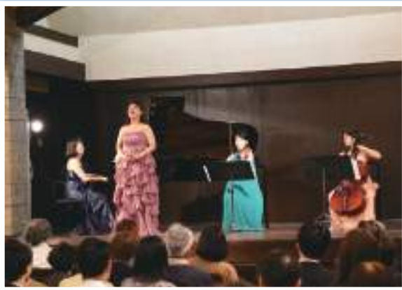
チャリティコンサート