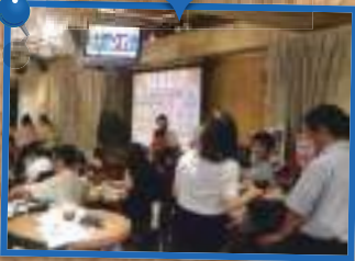
チャリティー暑気払い