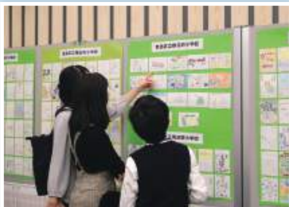
応募作品を熱心に見る参加者