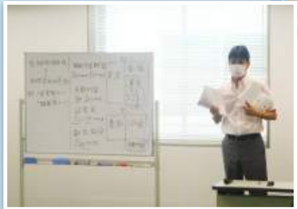
日商簿記3級程度の実力がつくことを目標に学ぶ