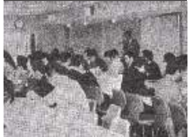
青年部会設立総会開催