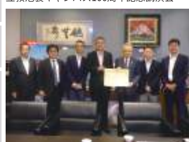
豊島区にマスク・医療用グローブを寄付