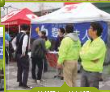
池袋駅東口献血活動