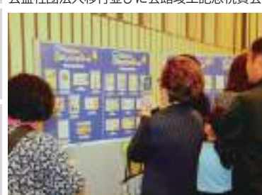
第1回豊島子ども秋の表彰式