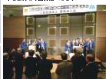
公益社団法人移行並びに会館竣工記念祝賀会