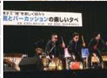
「税とパーカッションの楽しい夕べ」