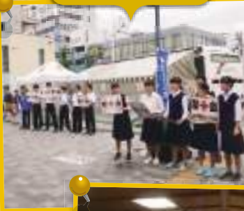
目白駅前献血活動