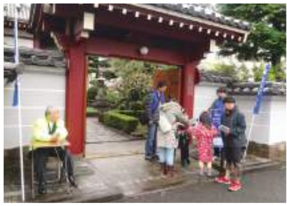
豊島税務署協力の税金クイズに挑戦する参加者