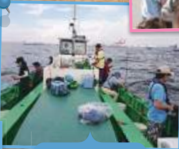
貸切船で楽しむアジ釣り