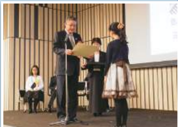
豊島法人会長賞を表彰