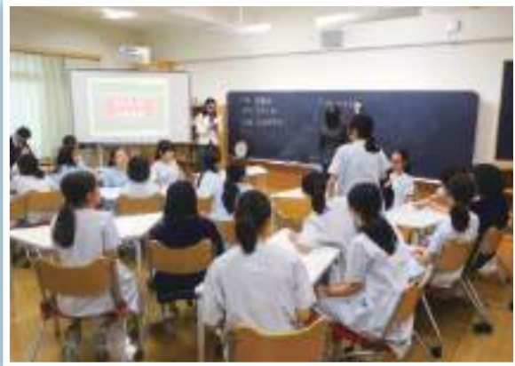
どんな税金があったらいいかを発表