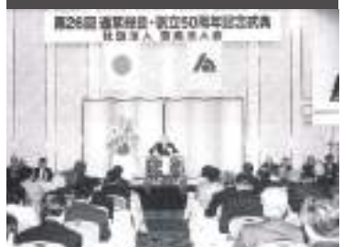
創立50周年記念式典開催